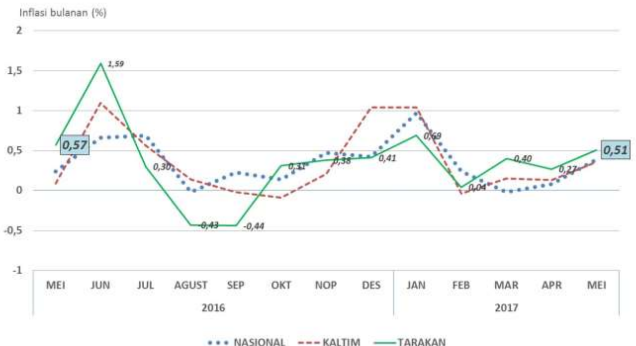
Grafik 2. Inflasi Bulanan Kota Tarakan, Kalimantan Timur dan Nasional Bulan Mei 2016 – Mei 2017

Pada bulan Mei 2017 kelompok pengeluaran yang memiliki andil yang dominan terhadap Inflasi Kota Tarakan dari yang terbesar yaitu kelompok bahan makanan memiliki andil Inflasi 0,31 persen, diikuti kelompok perumahan, air, listrik, gas dan bahan bakar yang memiliki andil Inflasi 0,06 persen, kelompok transportasi dan komunikasi memiliki andil Inflasi 0,05 persen, kelompok makanan jadi, minuman, rokok dan tembakau memiliki andil Inflasi 0,04 persen, kelompok sandang memiliki andil Inflasi 0,03 persen, kelompok kesehatan memiliki andil Inflasi 0,01 persen, dan kelompok pendidikan, rekreasi dan olah raga memiliki andil Inflasi 0,01 persen